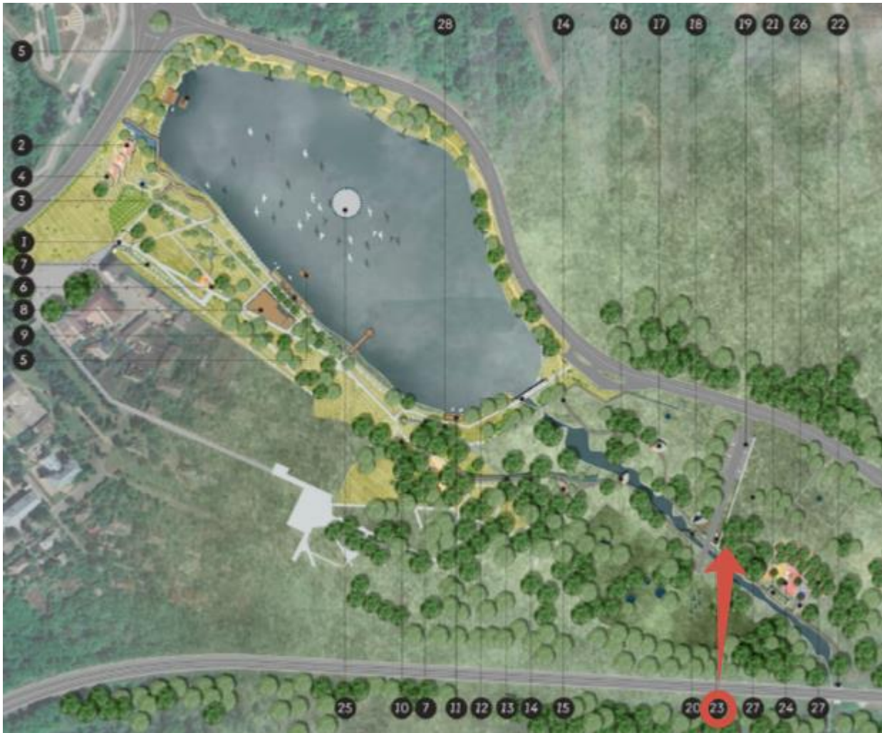
Схема расположения зданий и сооружений на территории природного парка «БИОНИКА»